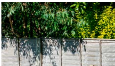
Overhangende bomen en struiken