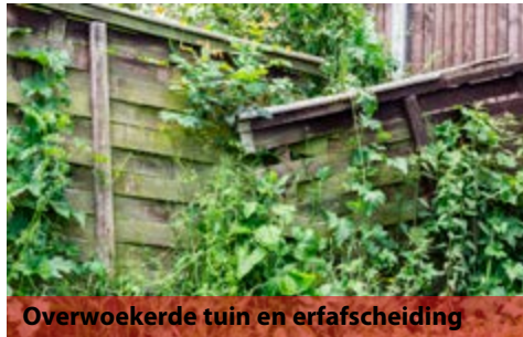
Overwoekerde tuin en erfafscheiding