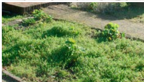
Onverzorgde tuin en straatwerk