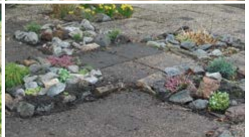
Verzorgde tuin en straatwerk